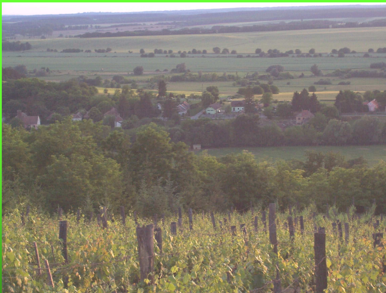
Zalai Borút Egyesület