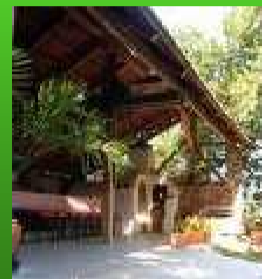
Zalai Borút Egyesület